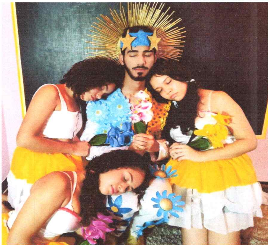
- Produção Audiovisual.