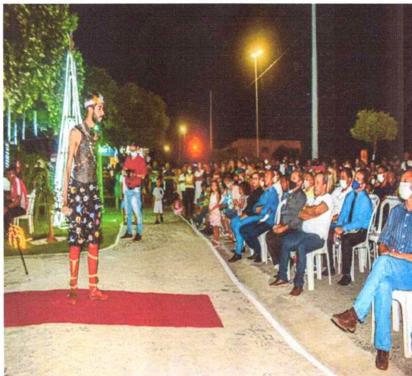
- Evento Social: Natal Feliz.