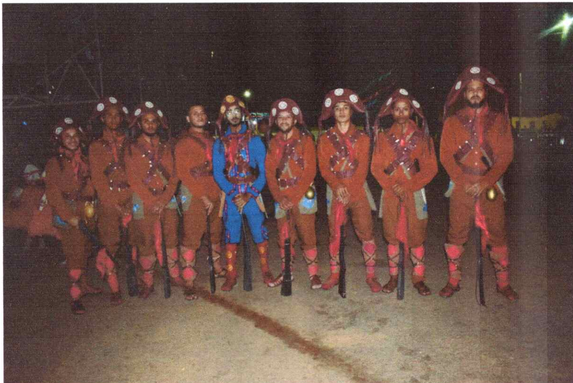
- Evento Cultural: Grupo Cultural Filomena Forrozera.