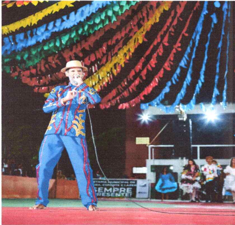
- Evento Cultural: Arraiá do Coroné.