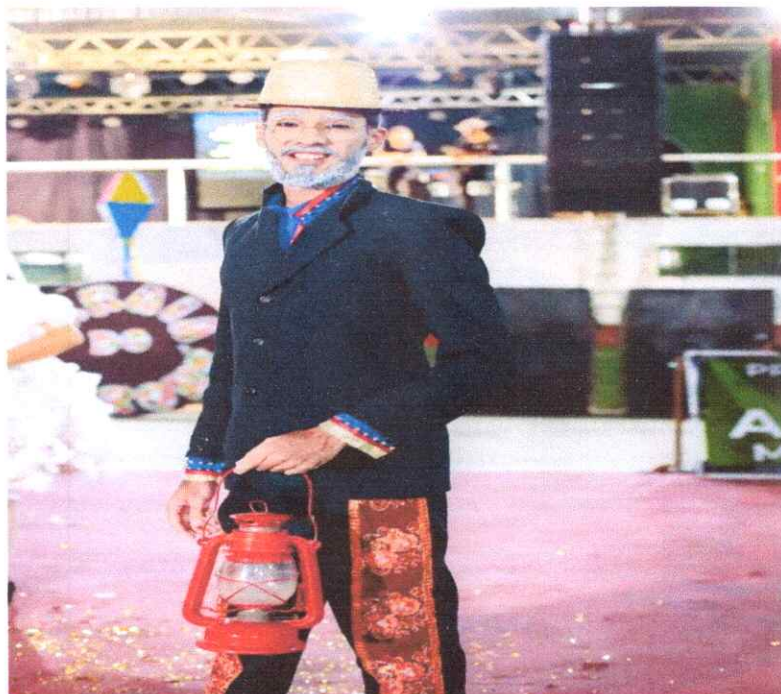
- Evento Cultural: Arraiá do Coroné.