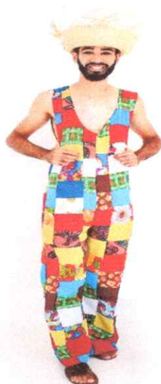
- Produção Audiovisual.