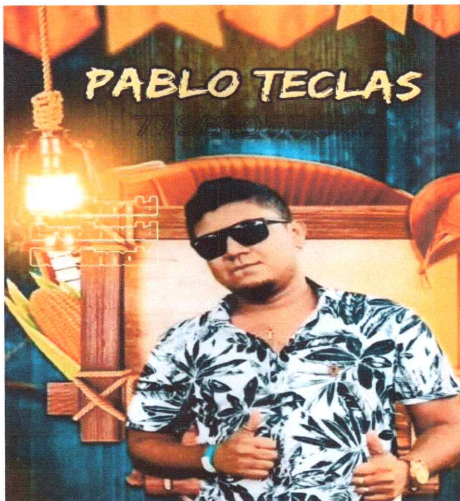
- Card de Divulgação Profissional.