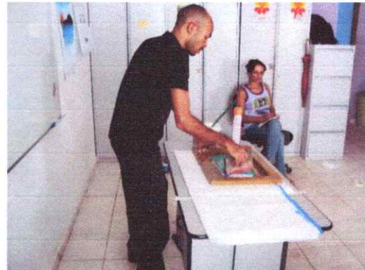
Colégio Antônio Rodrigues