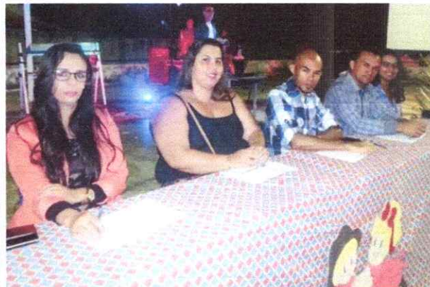
Jurado São João