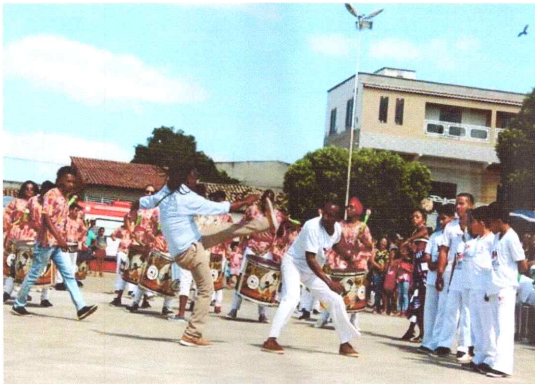
- Evento Cultural.