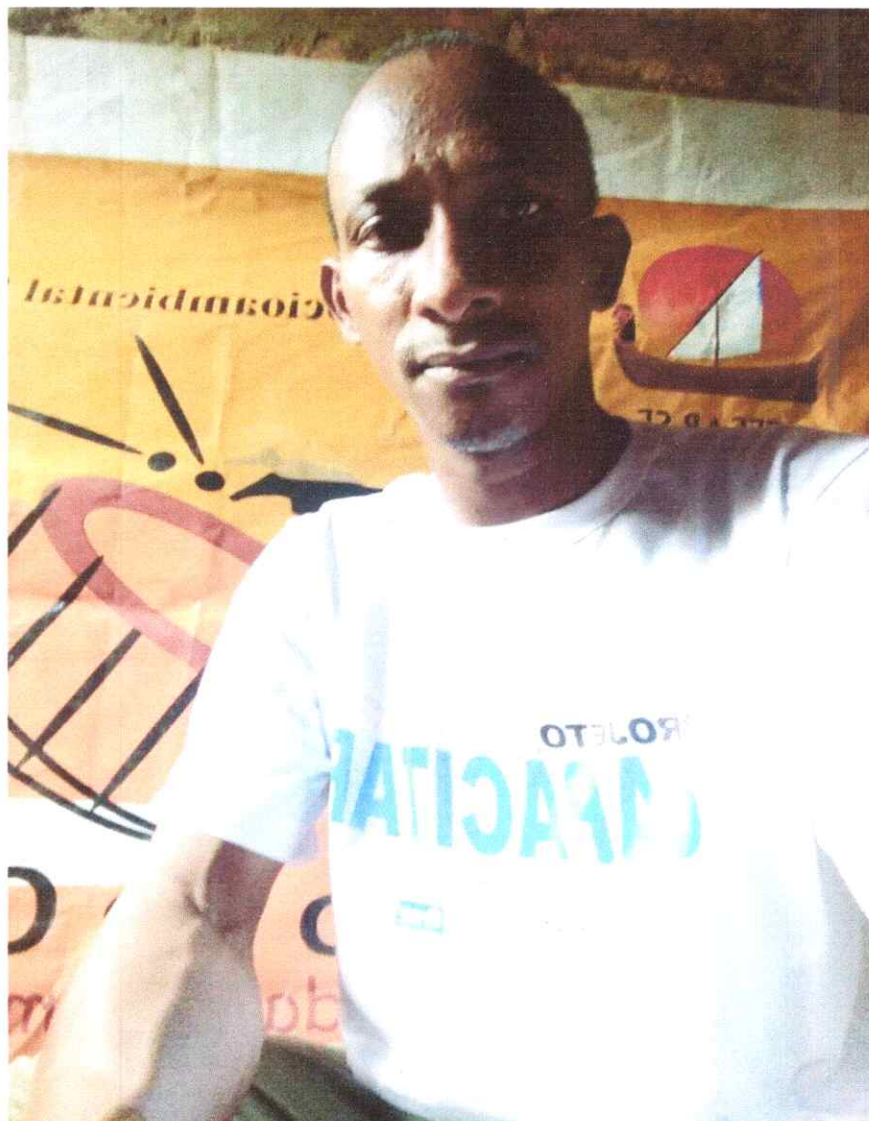
- Fotografia: Autodeclaração – Preto.