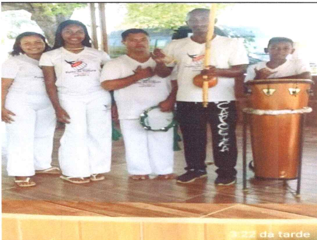
- Evento Cultural.