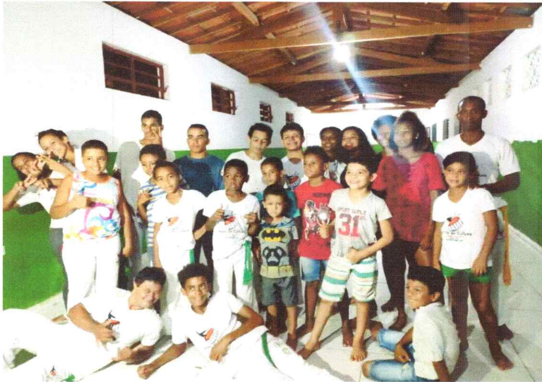
- Evento Educacional.