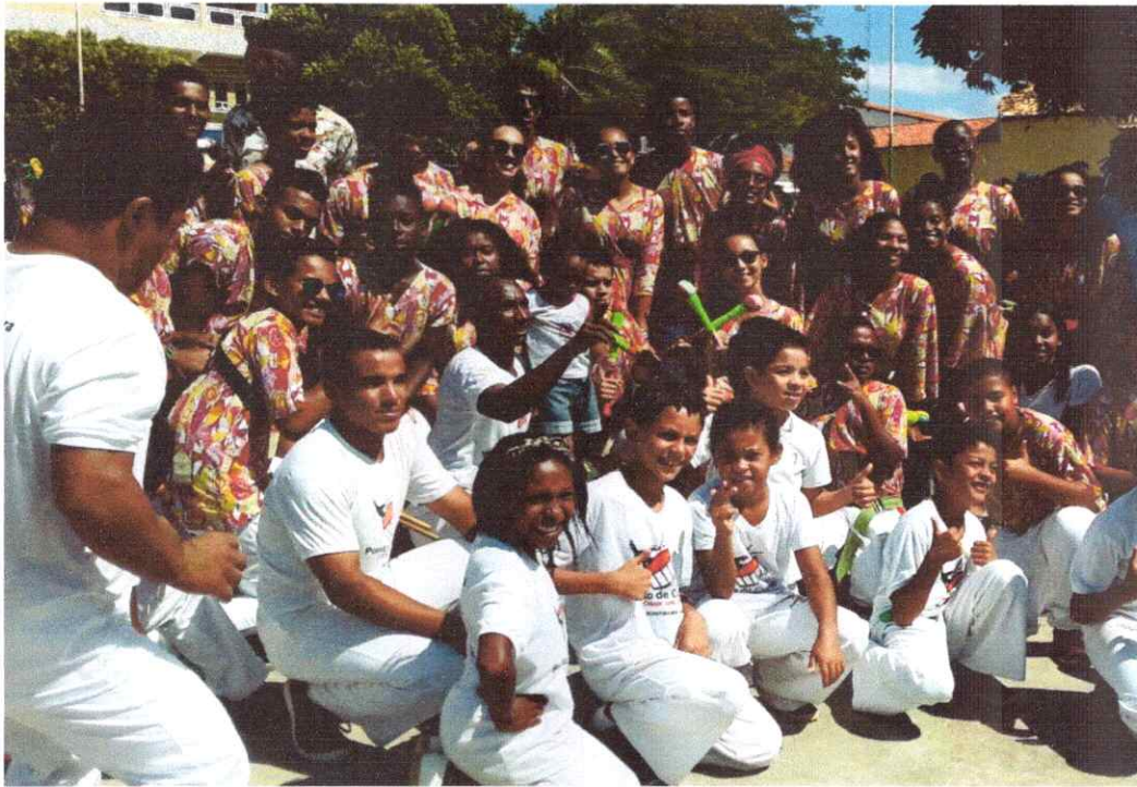
- Evento Cultural.