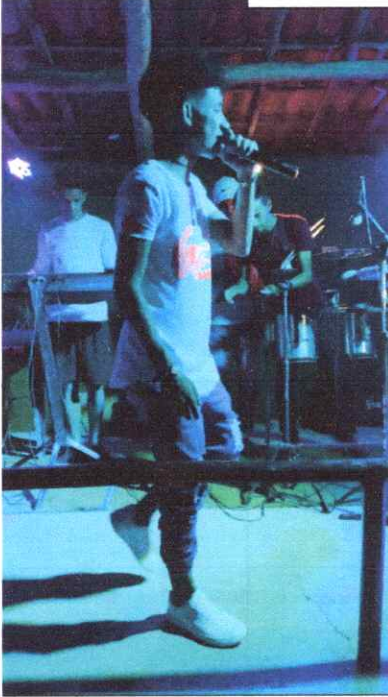
FOTOS DE MOMENTOS EM APRESENTAÇÕES DIVERSAS