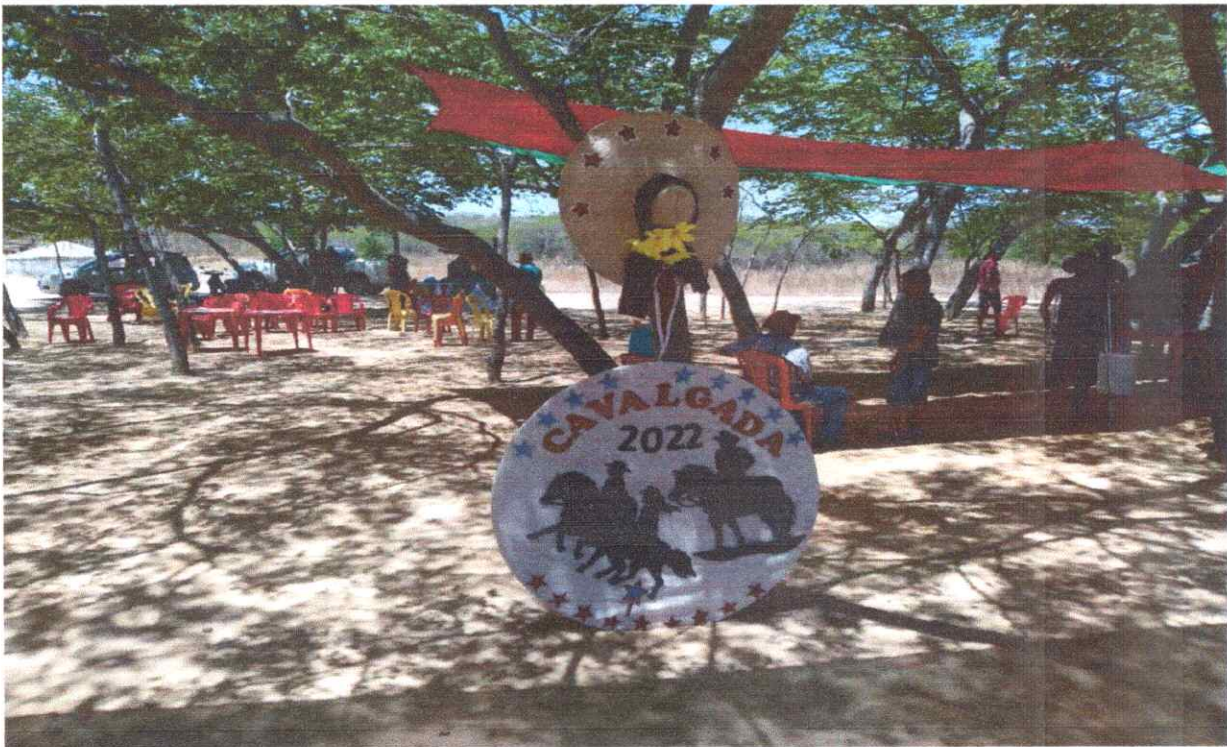
Imagens do local do evento, Placas de identificação, arvores para melhor acolhimento dos visitantes